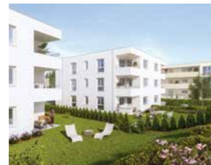
Parkvillen Schöndorf in Vöcklabruck, Dürnauerstraße 24.

Zwischen 80 m² und 96 m² Wohnfläche stehen den künftigen Bewohnern zur Verfügung. Die Wohnungen im Erdgeschoß erhalten zudem schöne großzügige Eigengärten und Terrassen . Jene im ersten oder zweiten Geschoß bieten sonnige Loggien und Balkone. Ein Lift, vom Keller bis ins Dachgeschoß, sichert die Wohnqualität bis ins hohe Alter.