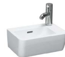
Handwaschbecken „Laufen Pro A“, 36 x 25 cm