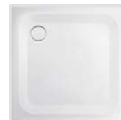
Brausetasse „Vigour Derby“, 90 x 90 cm