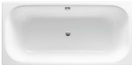
Badewanne „Vigour Derby“, Stahl-Email, 170 x 75 cm