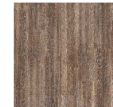
Vinyl-Boden „Brown Limed Oak V4“