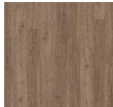
Vinyl-Boden „Waxed Oak V4“