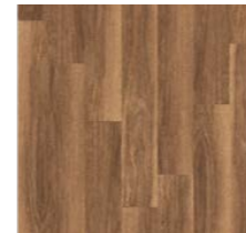
Vinyl-Boden „Classic Nut tree V4“