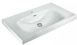
Möbelwaschtisch „Vigour Derby“, Keramik, 80 x 48 cm