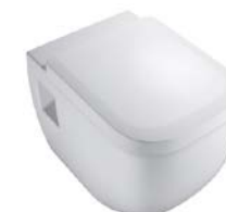
Wand-WC „Vigour Derby“, spülrandlos, WC-Sitz abnehmbar mit Absenkautomatik