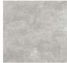
Fliese für Bäder/Toiletten „ASH“