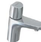
Standventil „Vigour Derby“ (nur Kaltwasser)

Druckbedingte Farbabweichungen – Abbildungen sind nicht farbverbindlich.