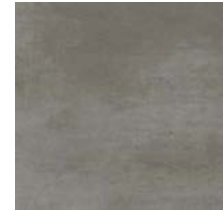
Fliese für Bäder/Toiletten „GREY“