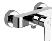
Einhand-Brausebatterie „Gessi Corso Venezia“